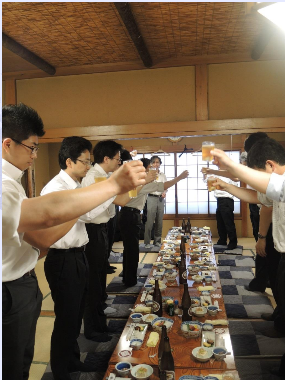
前中副委員長の挨拶で乾杯