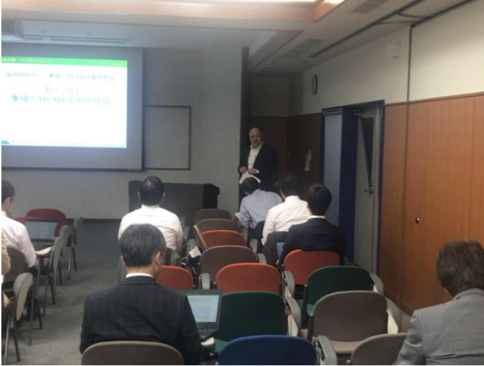
秦実行委員長の御挨拶