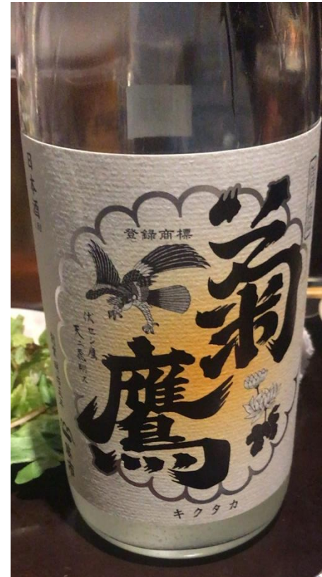
実行委員長より振舞われた 地元・愛知県産米を使用した純米酒